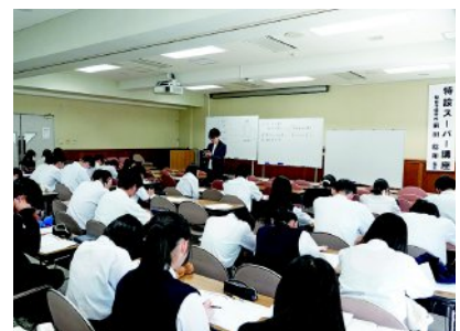
特設スーパー講座