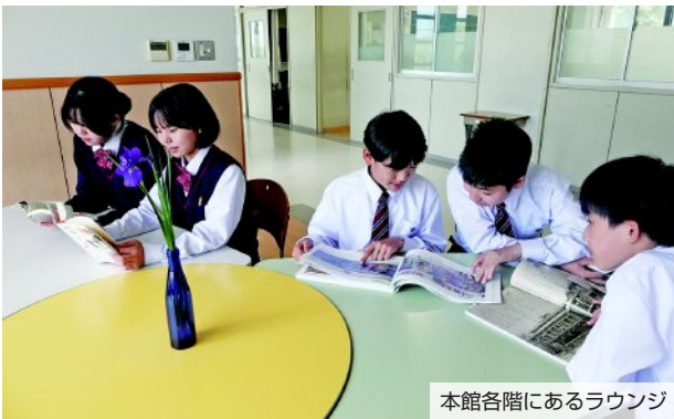
本館各階にあるラウンジ