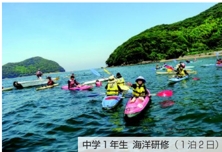
中学1年生 海洋研修（1泊2日）