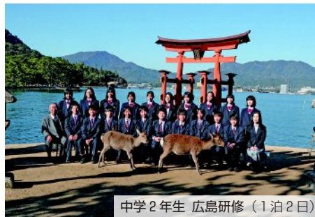
中学2年生 広島研修（1泊2日）