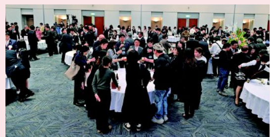
130周年記念ホームカミングで恩師と歓談する卒業生

2026年1月の「村崎学園創立130周年記念 徳島文理中学校・高等学校ホームカミング」には、本校を会場とした第一部とホテルを会場とした第二部に、合わせて1,000人近くの卒業生と家族が集い絆を深め合いました。