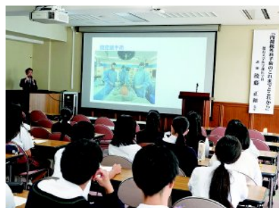
講演会「内視鏡外科手術のこれまでとこれから」