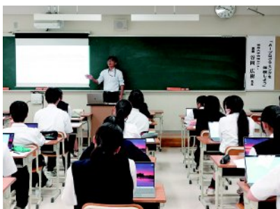
外部講師授業「AIプログラミングを体験しよう」