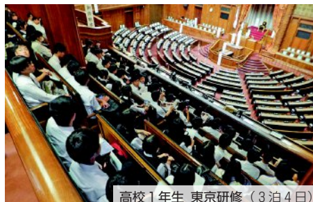
高校1年生 東京研修（3泊4日）