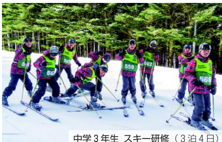
中学3年生 スキー研修（3泊4日）